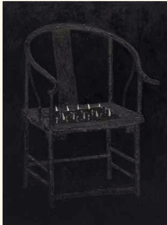
The chairs that no one sits on #1, 2015, oil, acrylic, enamel paint and steel razorblades on canvas