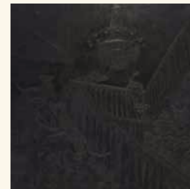
Lux, Oil and acrylic on canvas