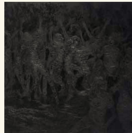
Riot #3, 2015, oil and acrylic on canvas

除了漫画，对于音乐，他也有一定的涉猎。他爱听音乐，亦爱玩音乐，尤其是摇滚与庞克，他曾经还是地下乐团的成员。绘画及创作的时候，他喜欢播放音乐，刺激创作神经。