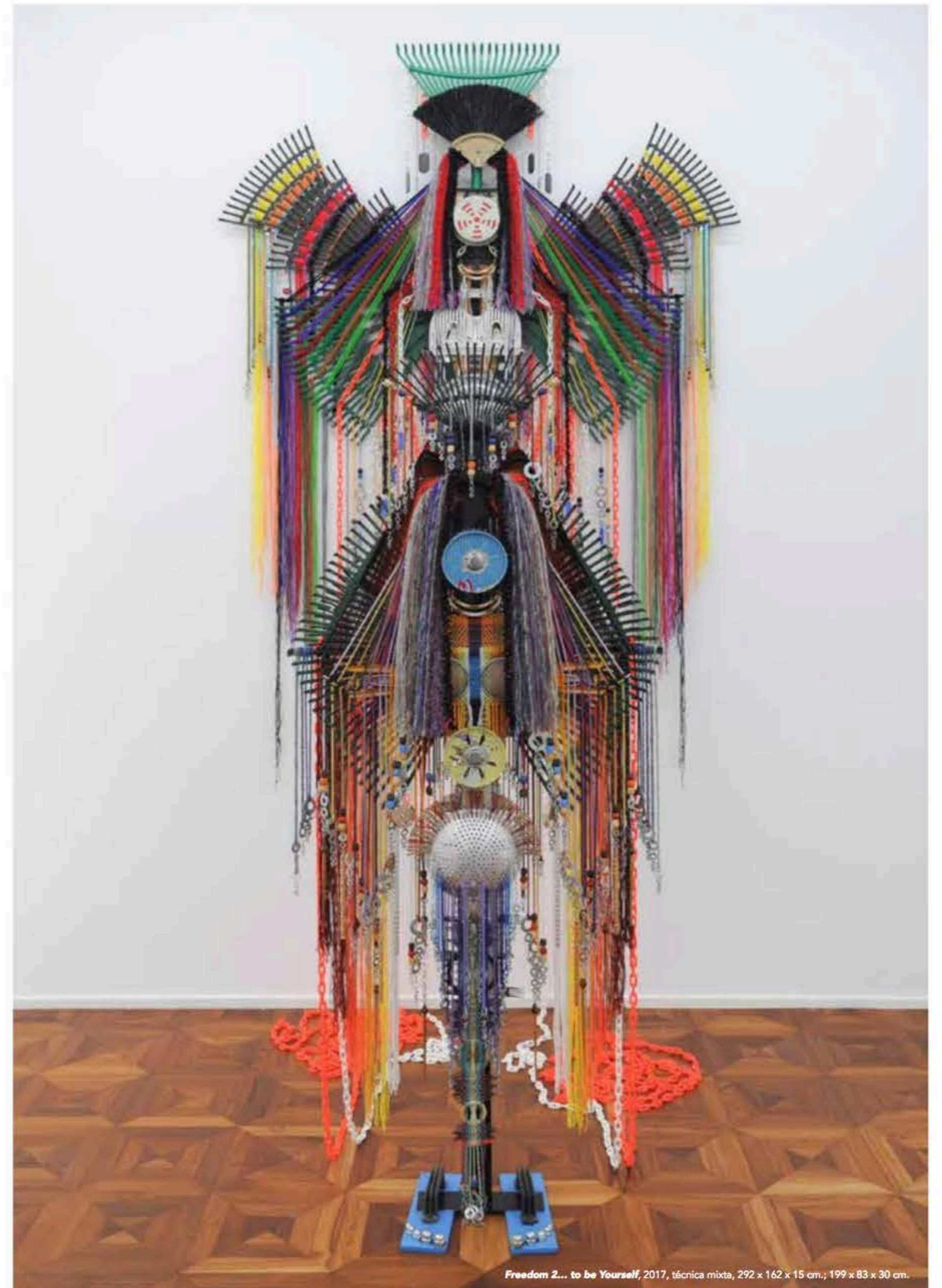
Freedom 2... to be Yourself, 2017, técnica mixta, 292 x 162 x 15 cm.; 199 x 83 x 30 cm.