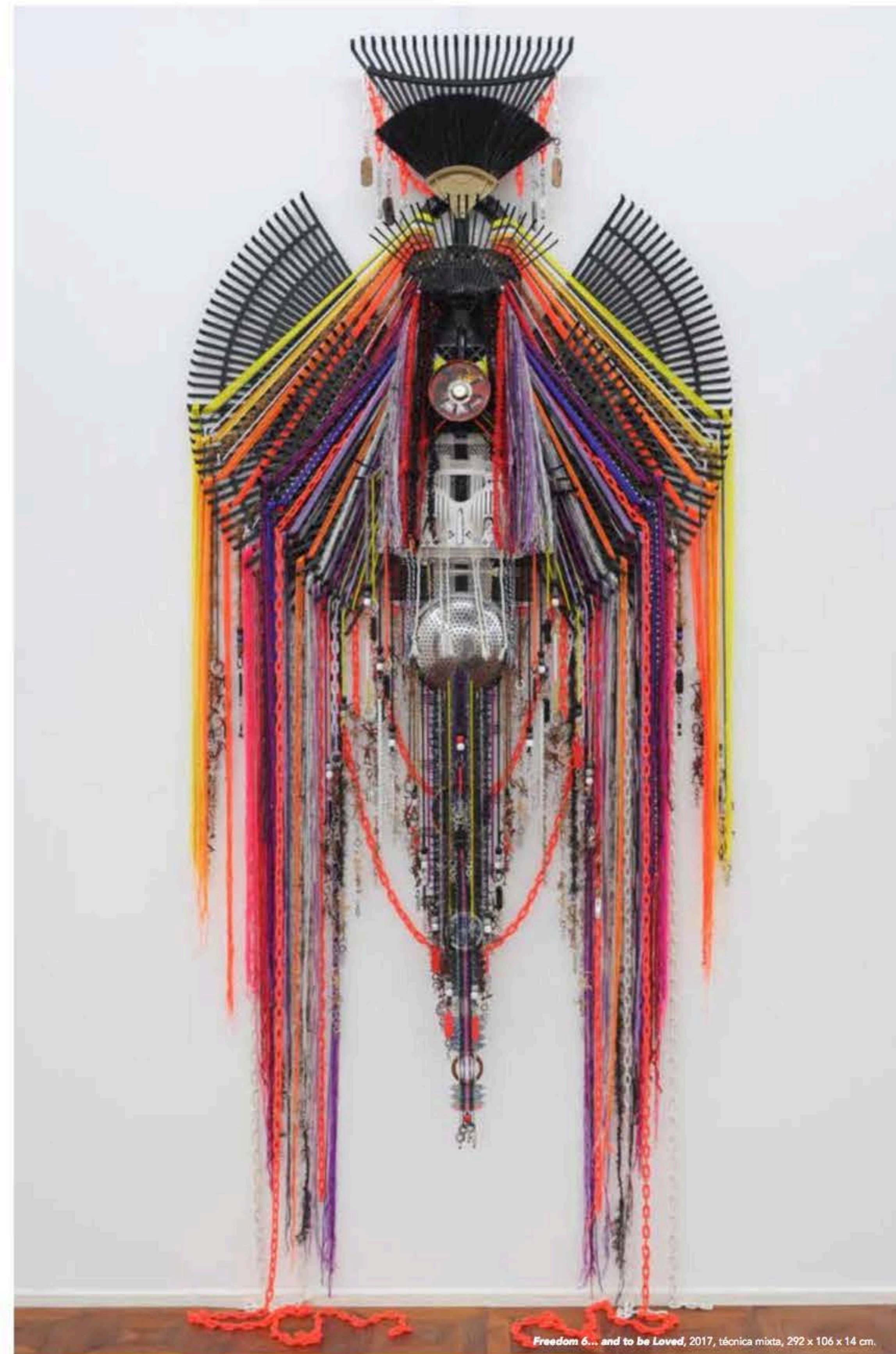
Freedom 6... and to be Loved, 2017, técnica mixta, 292 x 106 x 14 cm.

The title of her recent solo is a loaded one. Translated from a Malay proverb, the meaning behind Sultanate in the Eye, Monarchy at Heart , according to Anne, is quite simple - "It means 'to indulge in one's desires' - or another way to put it is 'to do according to his/her will'. Whatever a person wants to do, it is to follow their heart, sincerely." Freedom (2017), consists of 8 of majestic pieces mostly over 9 feet tall, it is indeed a pleasure to encounter.