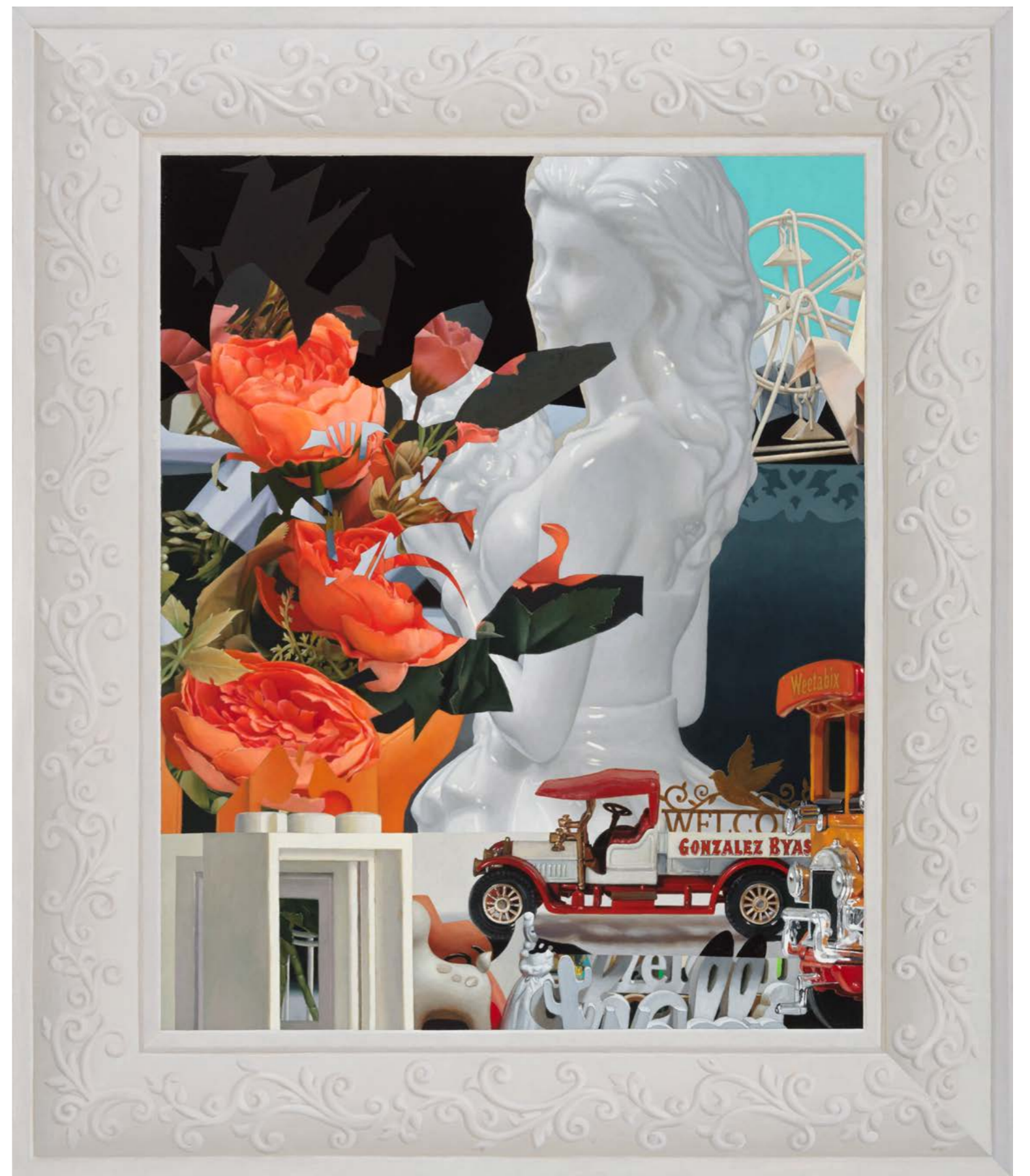
Day of Wine and Roses