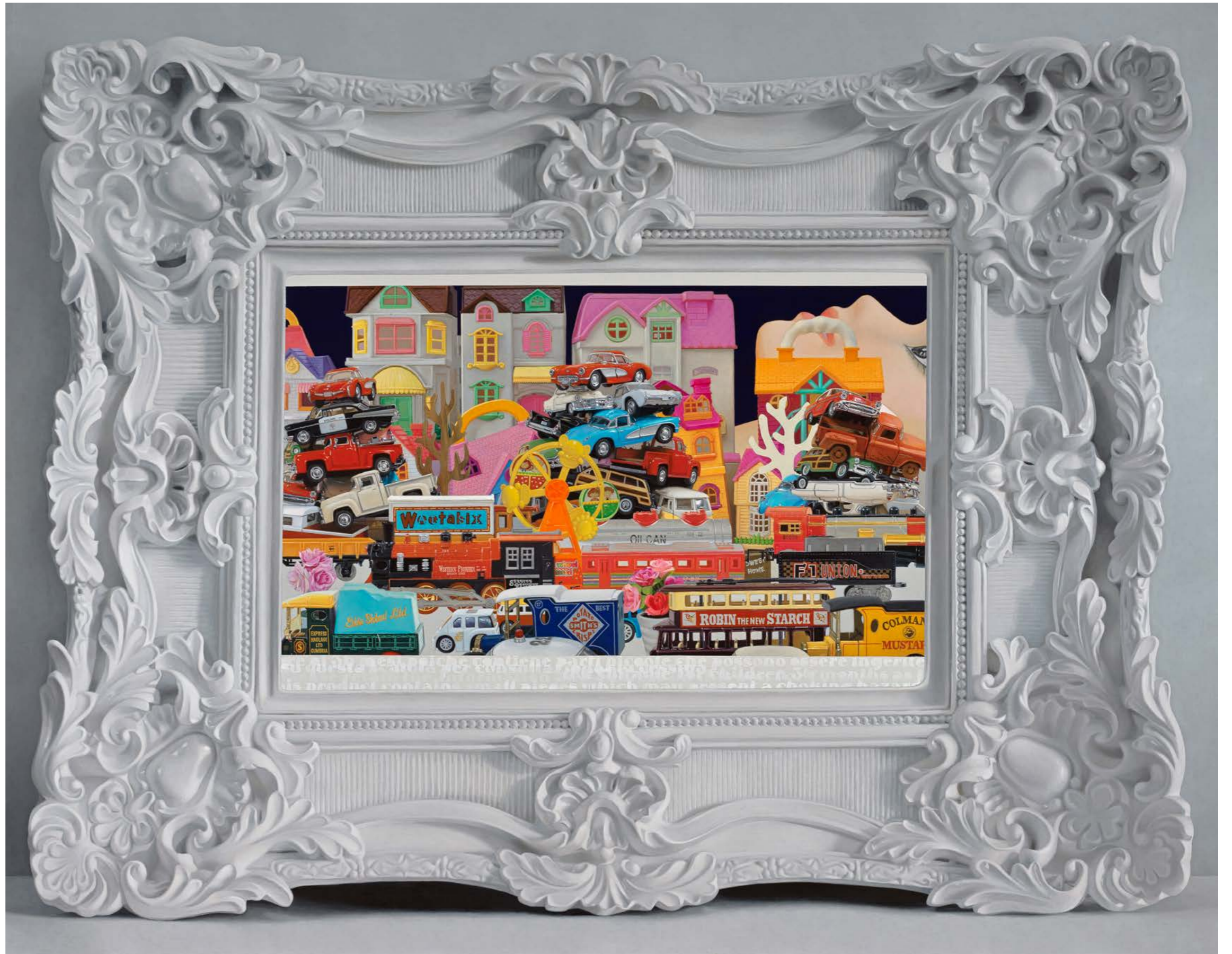
Sentimental Journey / Night Passage