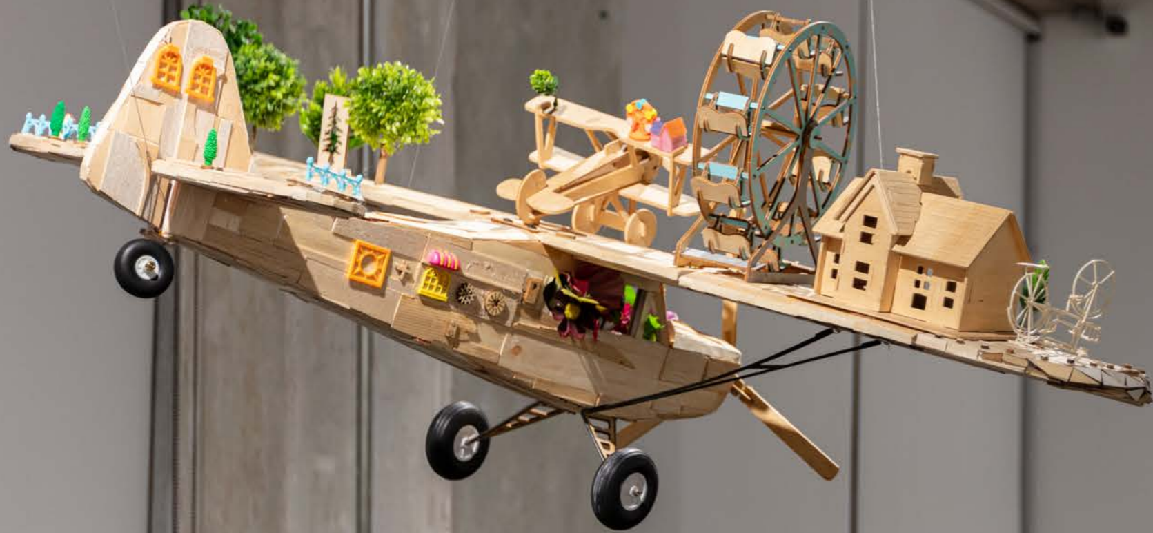
Installation view of "Ordinary Paintings From Silly Love Songs" at Richard Koh Fine Art, Bangkok, Thailand, 15 March - 05 April 2025