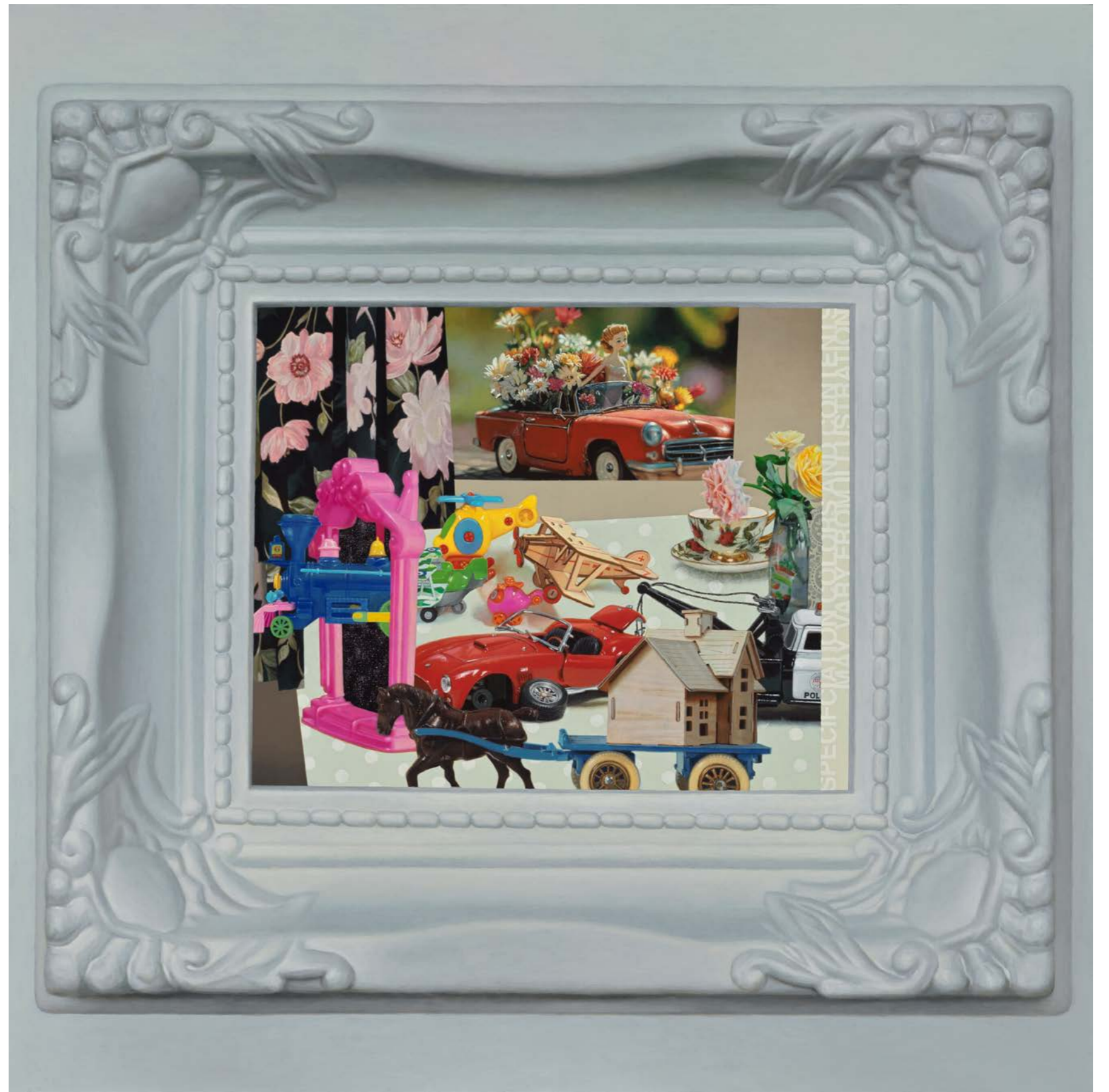
What A Difference A Day Made