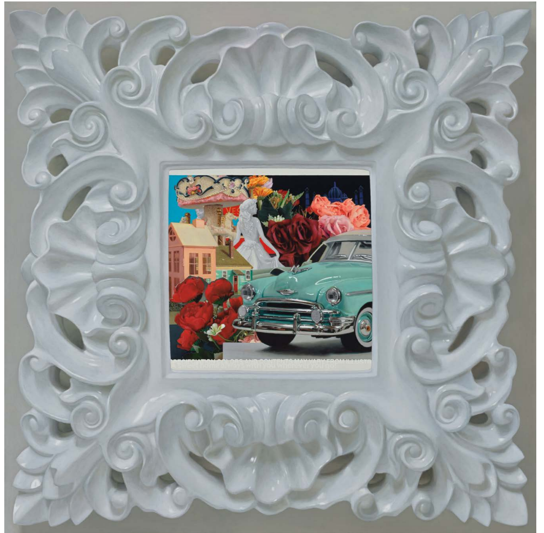
Night and Day