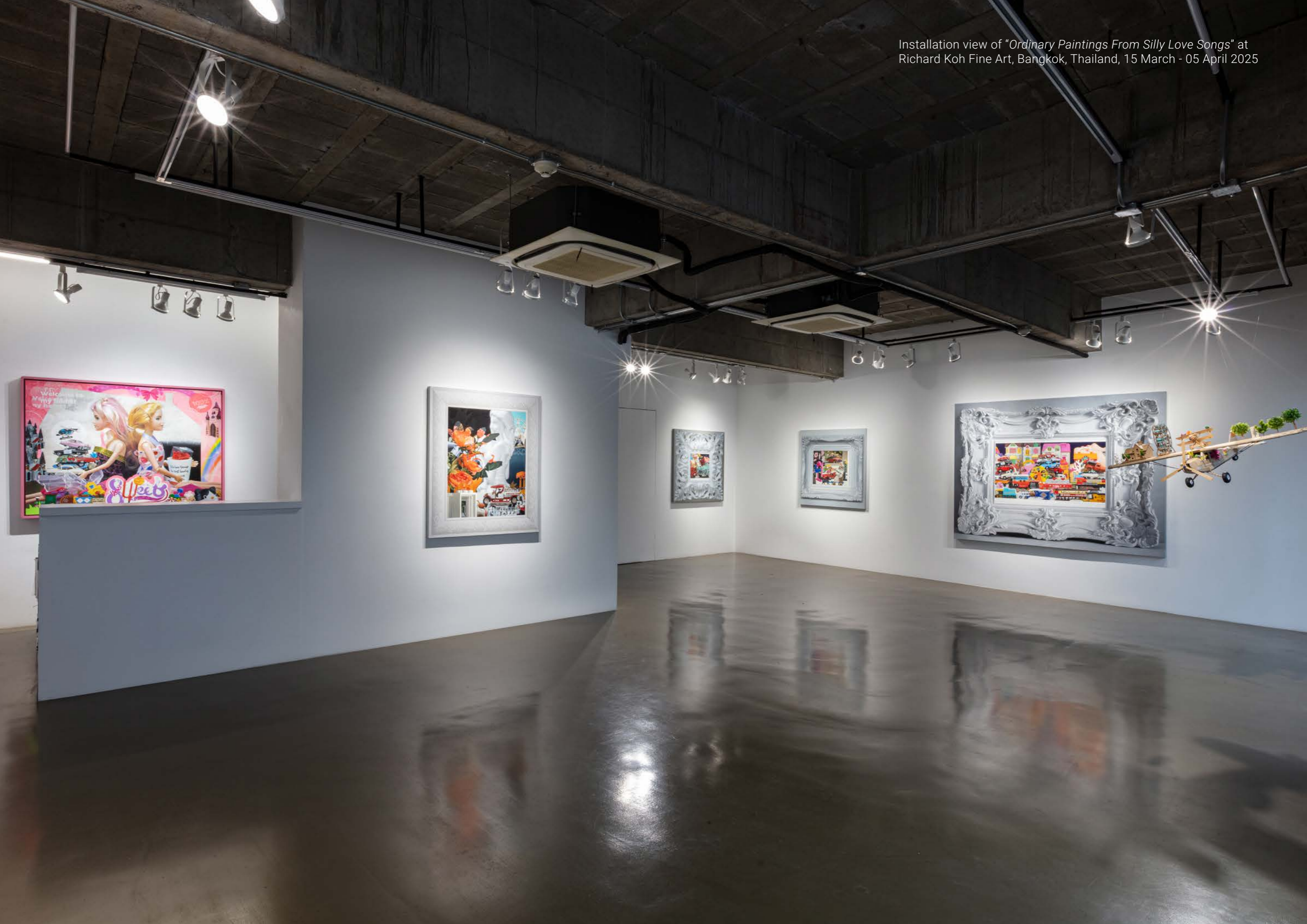
Installation view of "Ordinary Paintings From Silly Love Songs" at Richard Koh Fine Art, Bangkok, Thailand, 15 March - 05 April 2025