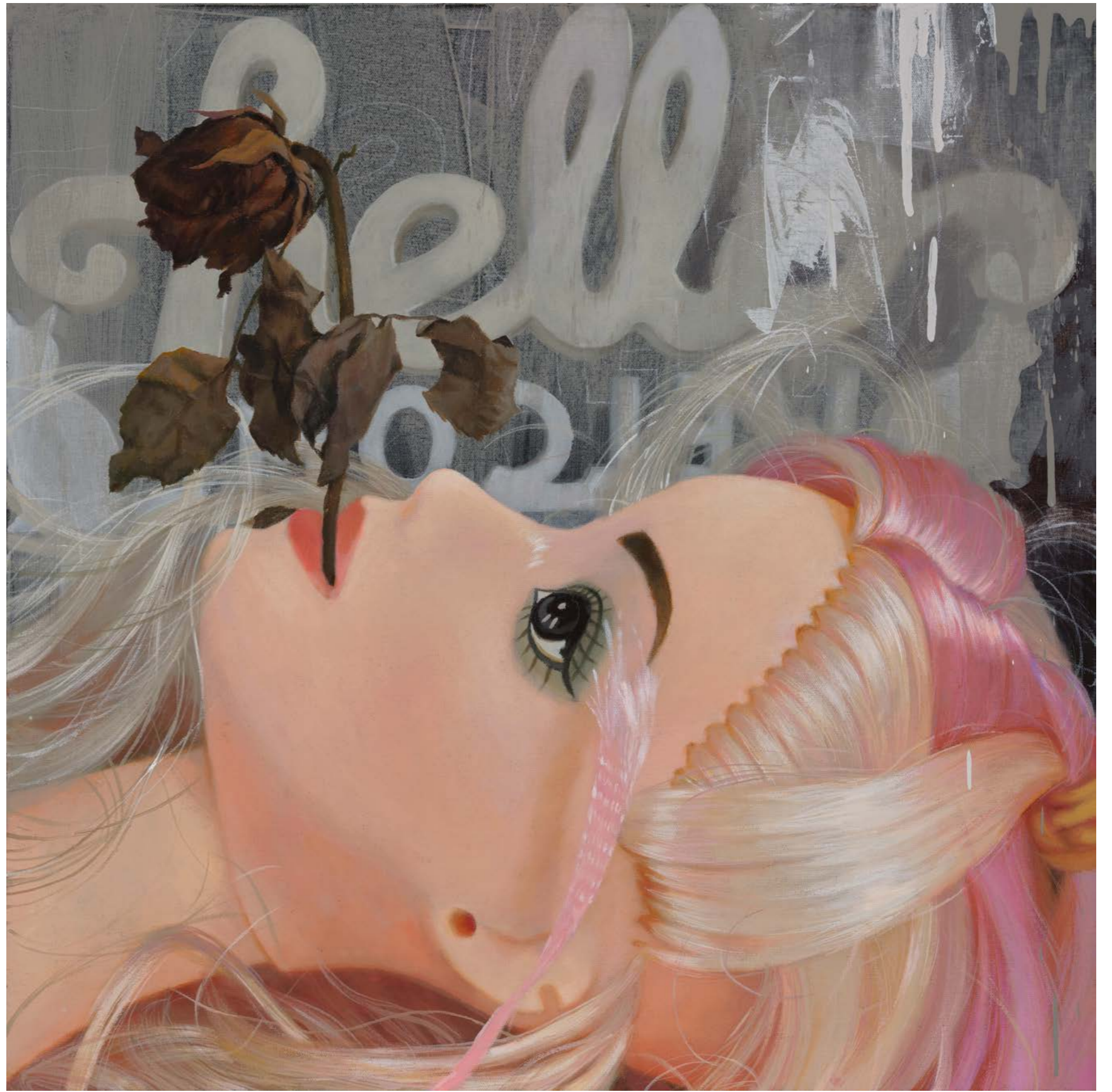
After The Love Has Gone