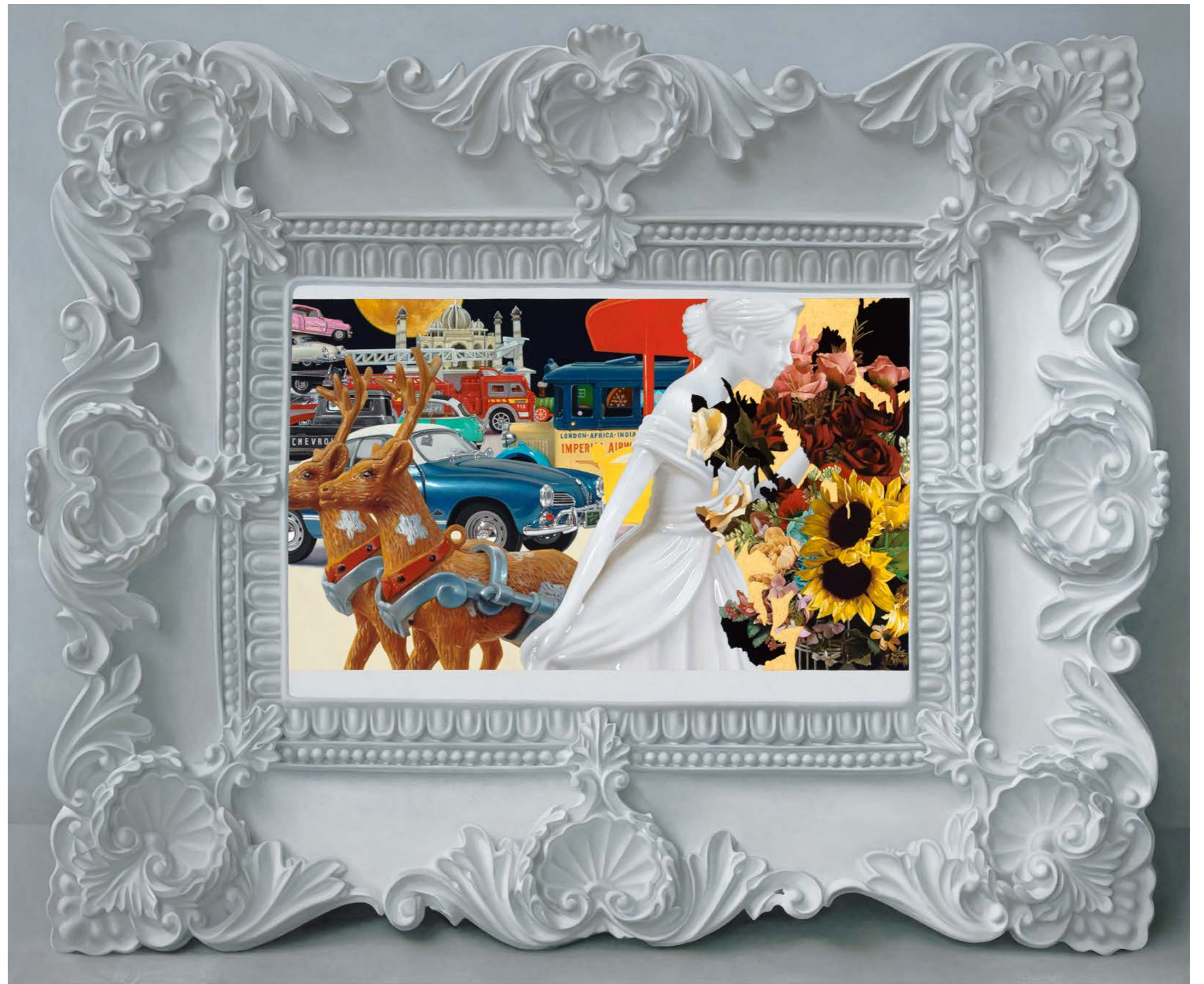
What A Little Moonlight Can Do