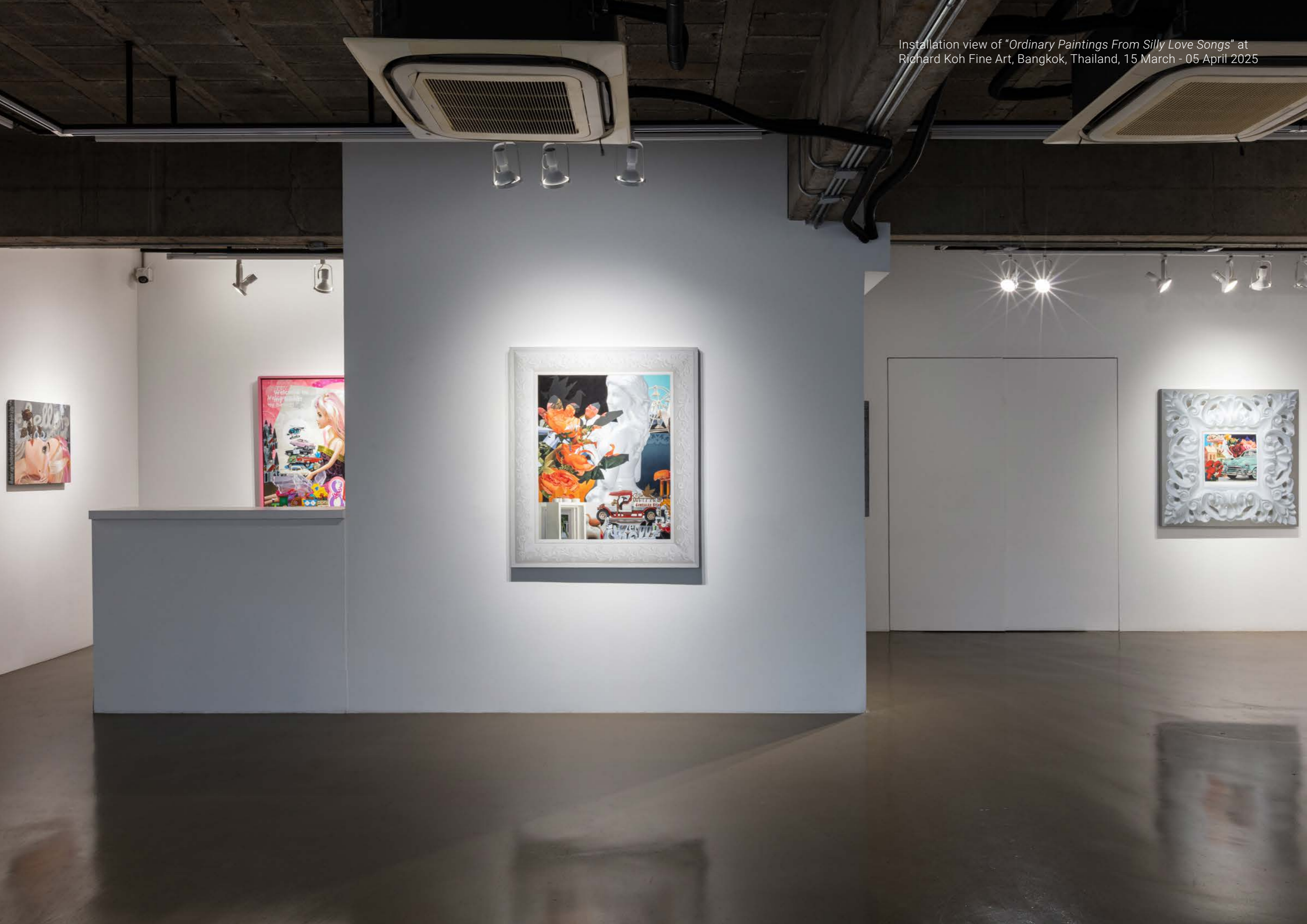
Installation view of "Ordinary Paintings From Silly Love Songs" at Richard Koh Fine Art, Bangkok, Thailand, 15 March - 05 April 2025