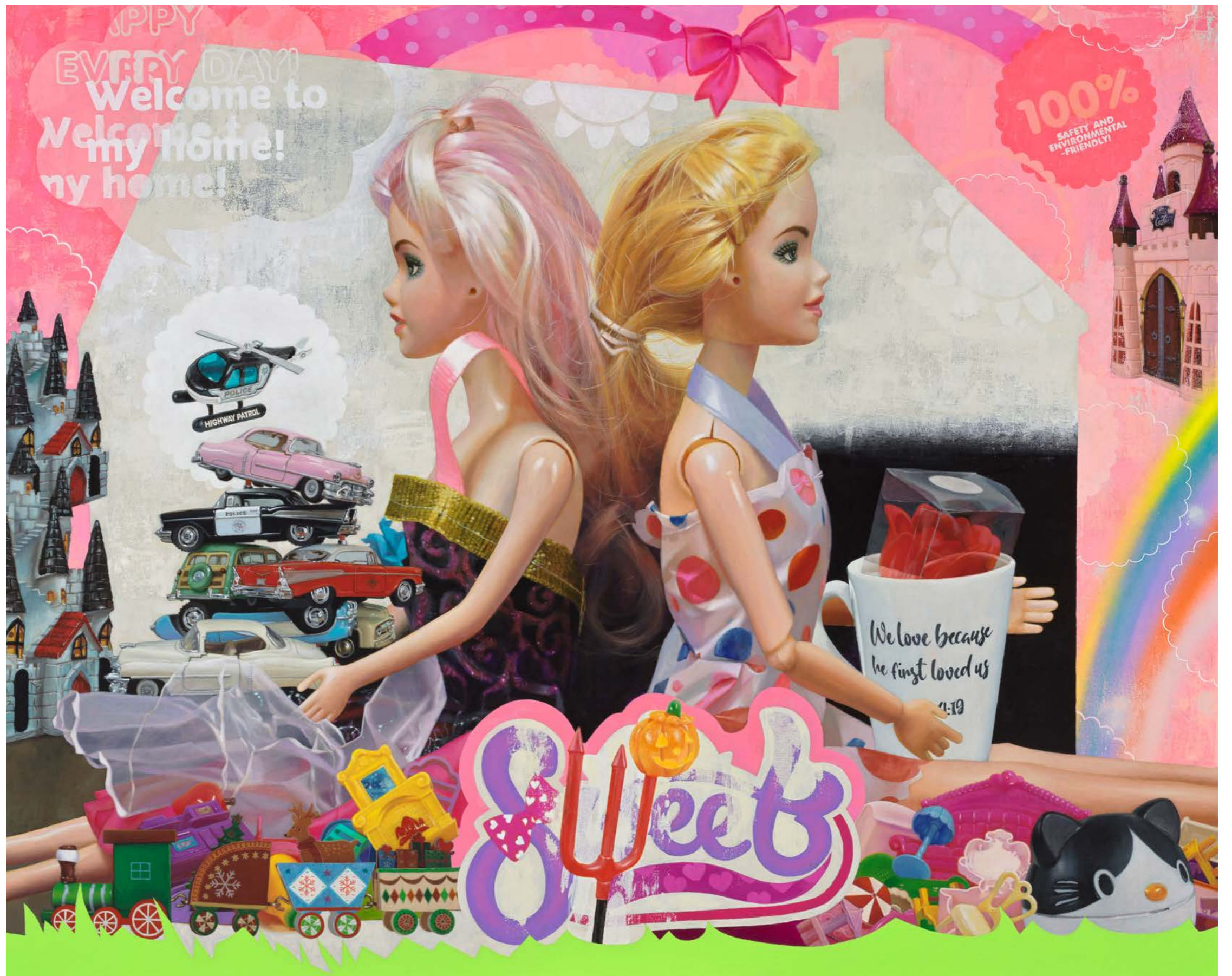
Home Sweet Home