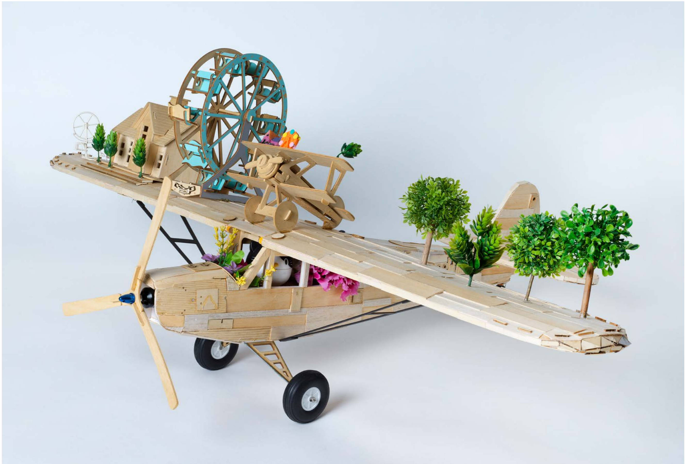
Come Fly with me